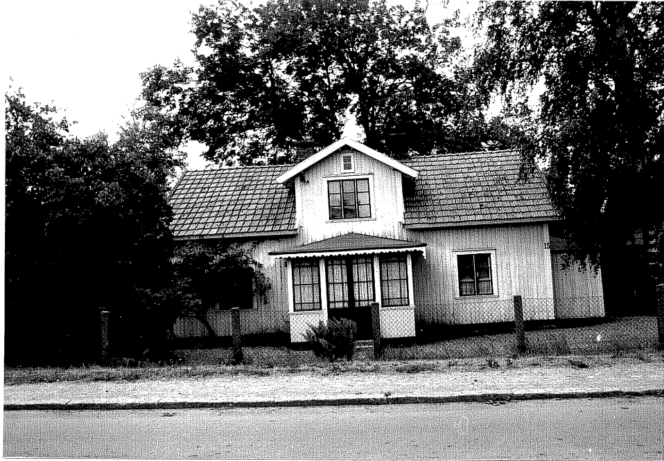
Neg. nr. V.T 01:22 Bostadshuset mot norr

Ödeshögs kommun V:a Tollstad socken Hästholmen Hallegården 4 24 Tollstad 2 5 "Fridensborg" Hamngatan 15