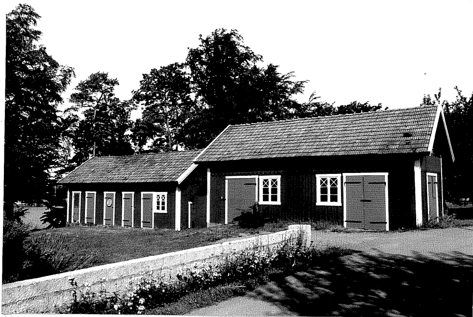
Neg. nr. V.T 03:9 Uthus mot sydost