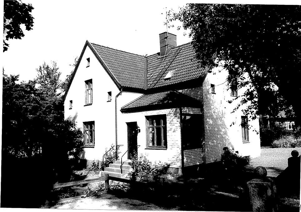
Neg. nr. V.T 03:8 Bostadshuset mot sydost

Ödeshögs kommun V:a Tollstad socken Hästholmen Hallegården 4 27 "Knutsro" Hallegatan 5