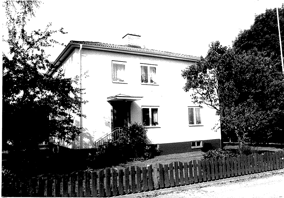
Neg. nr. V.T 03:14 Bostadshuset mot öster

Hästholmen Hallegården 4 28 Hallegatan 1