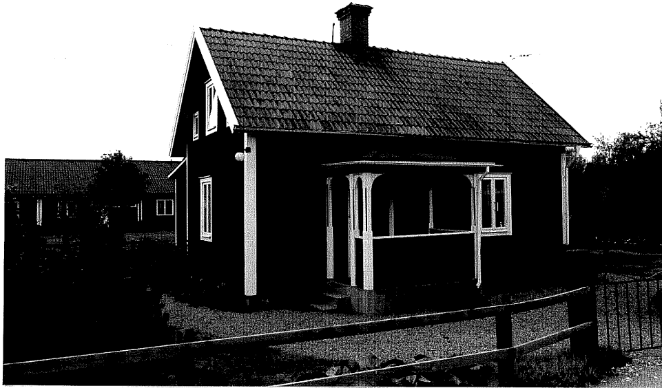
Neg. nr. V.T 01:14 Bostadshuset mot norr

Ödeshögs kommun V:a Tollstad socken Hästholmen Hallegården 4 40 Tollstad 2 14 Hamngatan 9