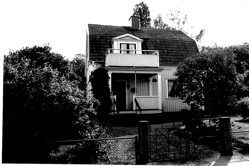
Neg. nr. V.T 03:10 Bostadshuset mot väster