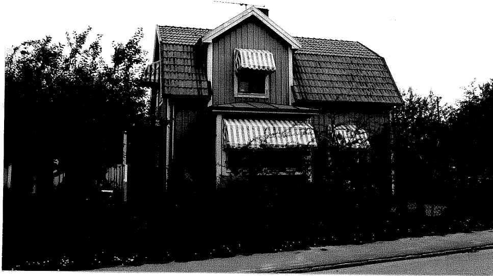
Neg. nr. V.T 01:28 Bostadshuset mot sydväst

Hästholmen Hallegården 4 44 Hamngatan 12