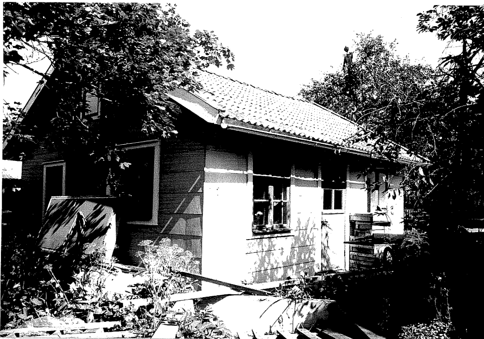
Neg. nr. V.T 02:25 Uthus mot stdväst