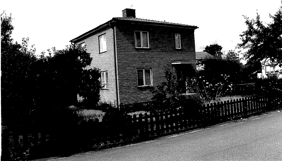
Neg. nr. V.T 02:13 Bostadshuset mot sydväst

Ödeshögs kommun V:a Tollstad socken Hästholmen Hallegården 4 4 Hamngatan 14