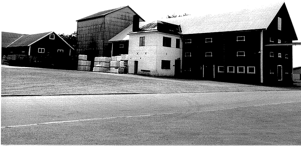
Neg. nr. V.T 04:2 Magasin mot norr

Ödeshögs kommun V:a Tollstad socken Hästholmen Hallegården Hamngatan 31