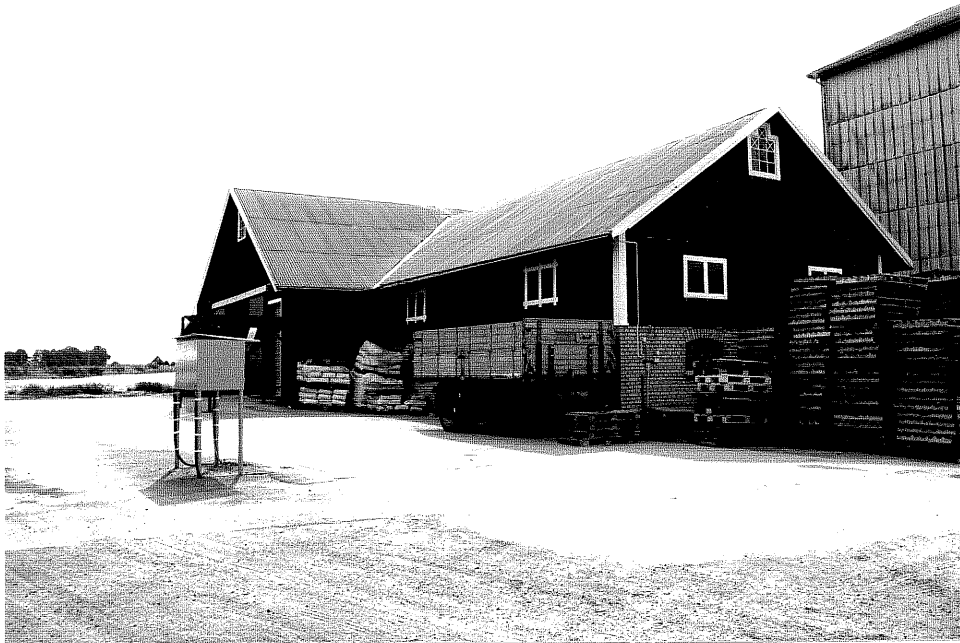
Neg. nr. V.T 04:4 Ladugård mot norr