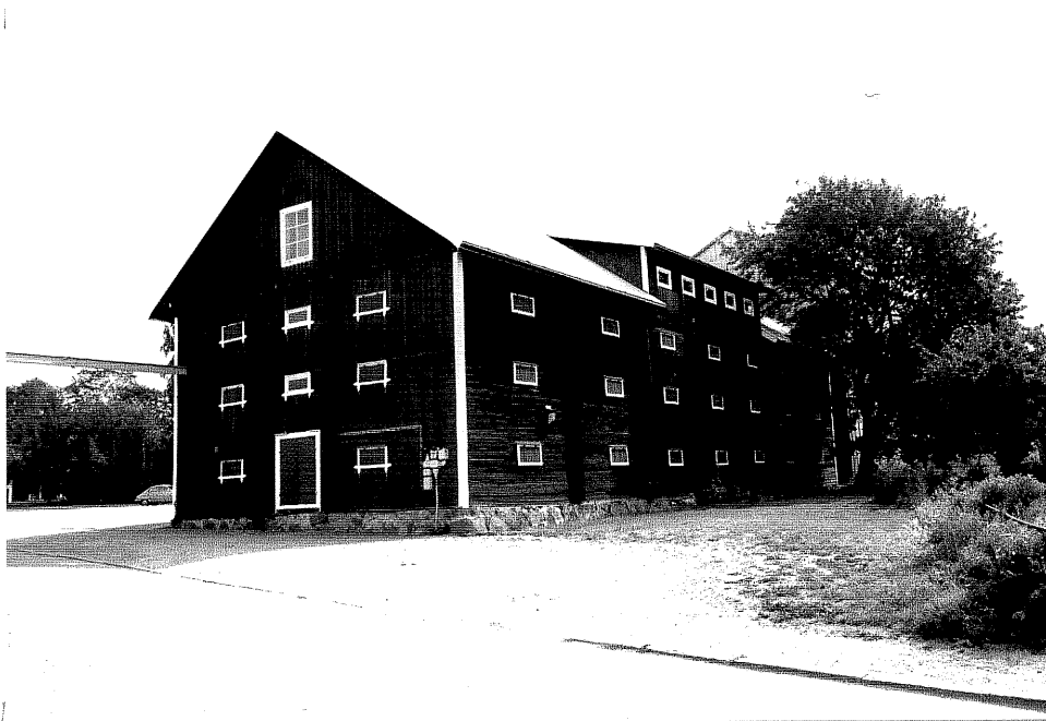
Neg. nr. V.T 04:3 Magasin mot väster