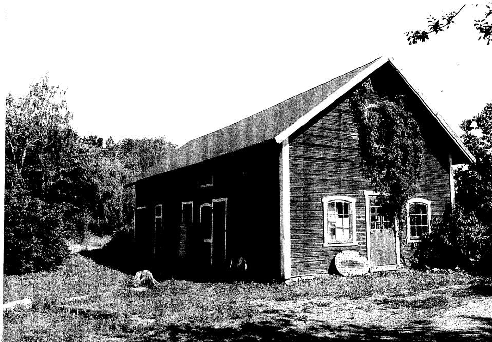
Neg. nr. V.T 03:30 Uthus mot sydväst