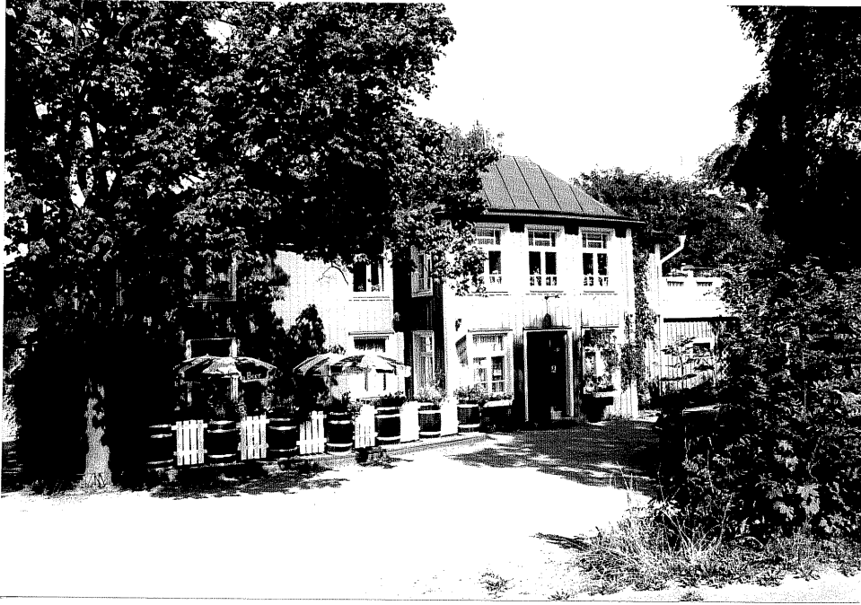
Neg. nr. V.T 03:31 Restaurang Vätterhästen mot söder

Ödeshögs kommun V:a Tollstad socken Hästholmen Hallegården 4 7 Vätterhästen Hamngatan 20