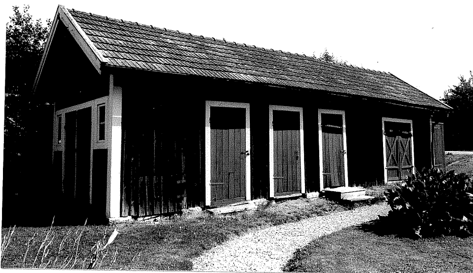
Neg. nr. V.T 02:24 Uthus mot väster