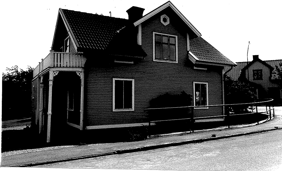
Neg. nr. V.T 02:23 Bostadshuset mot nordväst

Ödeshögs kommun V:a Tollstad socken Hästholmen Hallegården 4 8 , 4 10 Strömsholm Hamngatan 16