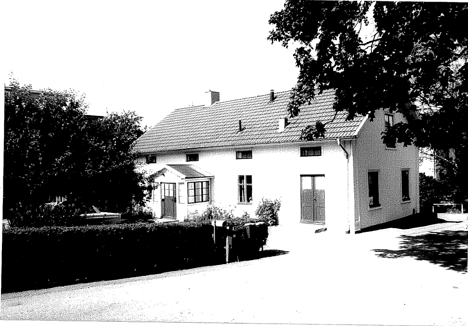
Neg. nr. V.T 03:32 Bostadshuset mot öster

Hästholmen Hallegården 4 9 Halleberg Hamngatan 20