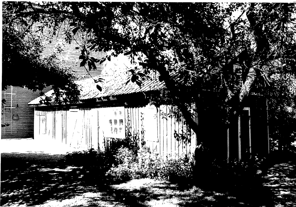
Neg. nr. V.T 03:33 Uthus mot öster