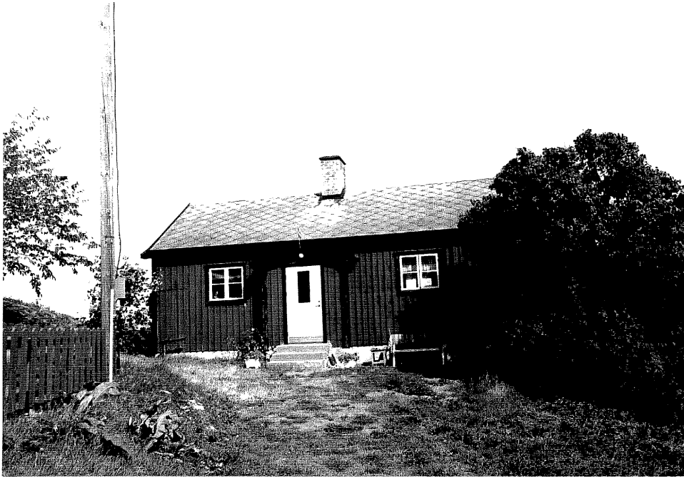
Neg. nr. V.T 03:24 Bostadshus mot söder

Ödeshögs kommun V:a Tollstad socken Hästholmen hamn 1 1 Lastbergsvägen 4