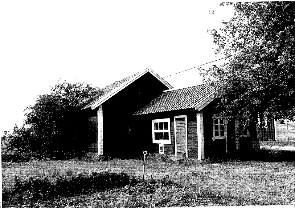
Neg. nr. V.T 06:34 Hönshus mot sydost