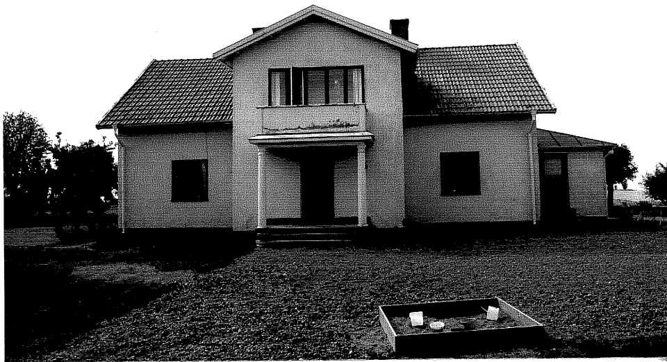
Neg. nr. V.T 06:31 Mangårdsbyggnaden mot öster

Ödeshögs kommun V:a Tollstad socken Hästholmen Norrgården 3 3