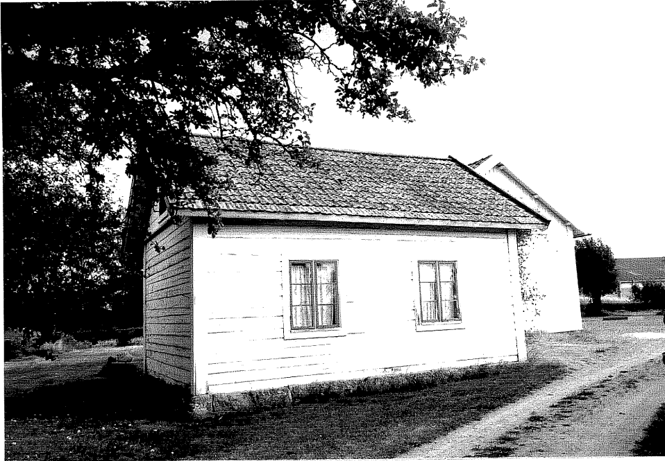
Neg. nr. V.T 06:33 Bod mot nordväst