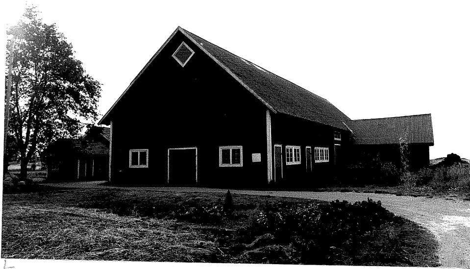
Neg. nr. V.T 06:35 Ladugård mot öster