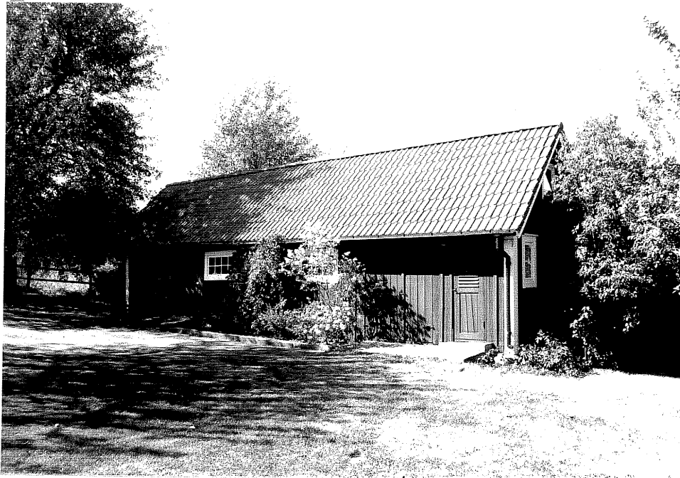
Neg. nr. V.T 06:3 Uthus mot öster

Ödeshögs kommun V:a Tollstad socken Hästholmen Västergård "Alviken"