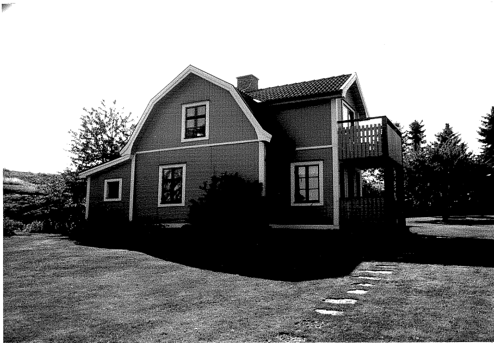
Neg. nr. V.T 06:2 Bostadshuset mot norr

Ödeshögs kommun V:a Tollstad socken Hästholmen Västergård 2 10 "Alviken"