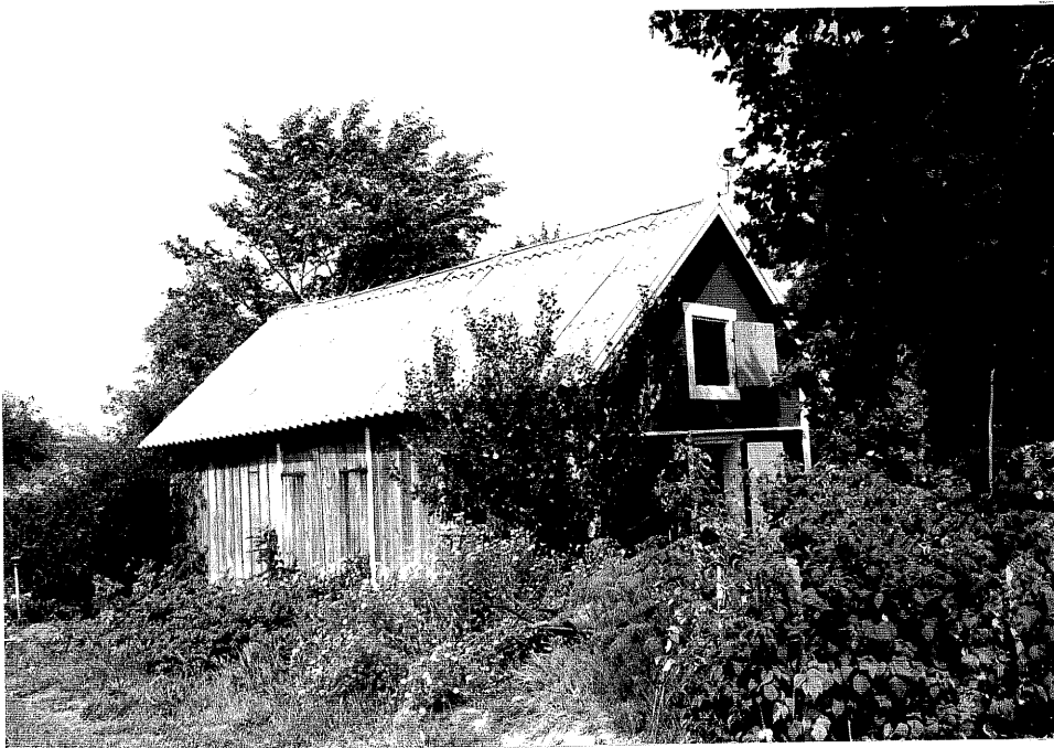
Neg. nr. V.T 05:9 Uthus mot söder