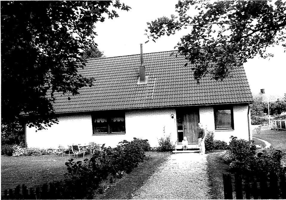
Neg. nr. V.T 05:10 Villan mot sydväst