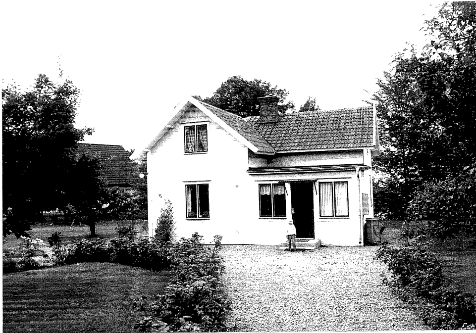
Neg. nr. V.T 05:5 Bostadshuset mot öster

Ödeshögs kommun V:a Tollstad socken Hästholmen Västergård 2 2 Sjöviksvägen 6