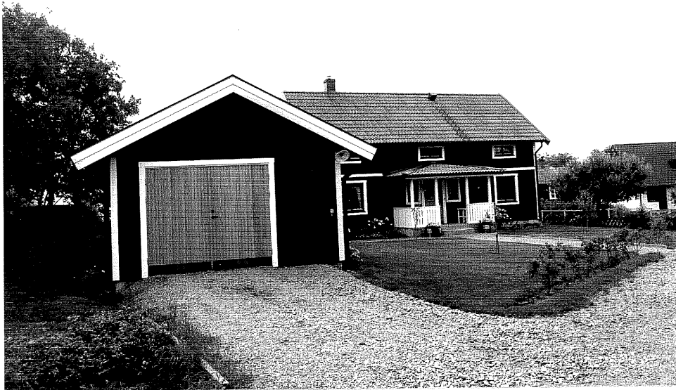
Neg. nr. V.T 05:6 Bostadshuset och garaget mot öster.

Ödeshögs kommun V:a Tollstad socken Hästholmen Västergård 2 5 Fiskaregrän 4 3