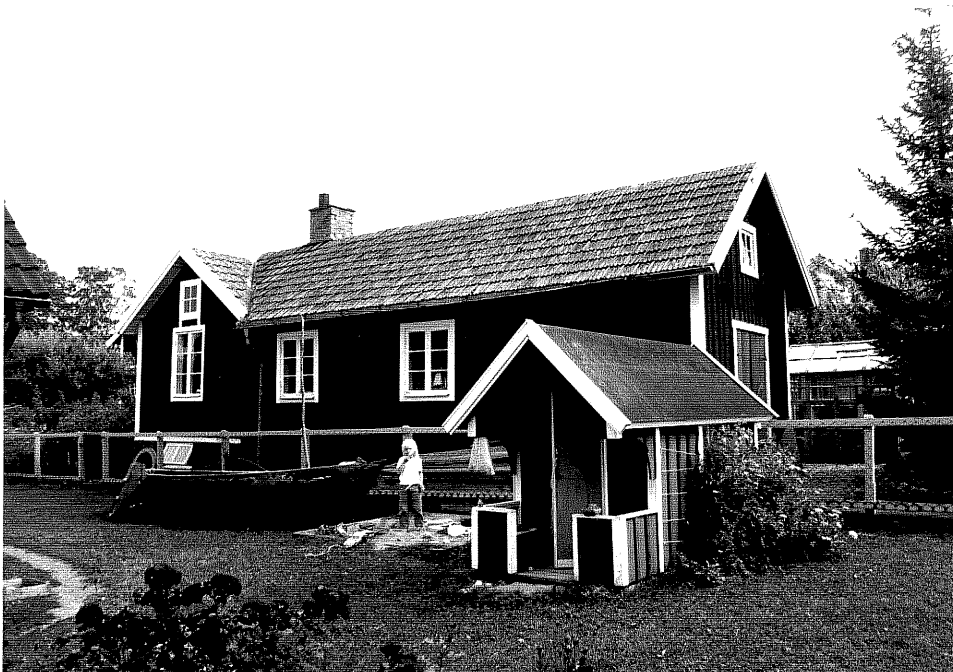
Neg. nr. V.T 05:11 Uthuset mot väster