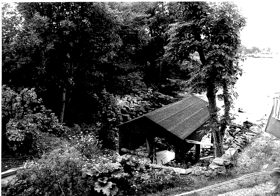
Neg. nr. V.T 05:1 Båthus mot nordost