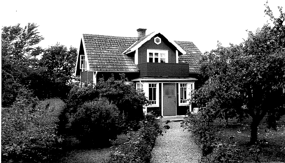
Neg. nr. V.T 05:4 Bostadshuset mot sydväst

Ödeshögs kommun V:a Tollstad socken Hästholmen Västergård 2 8 Sjöviksvägen 4