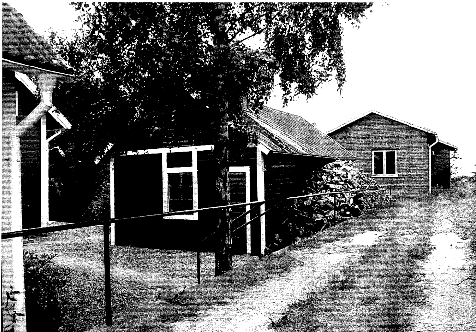
Neg. nr. V.T 05:3 Uthus mot öster