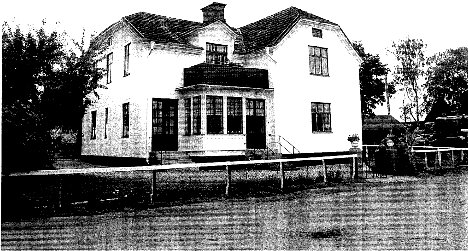
Neg. nr. V.T 04:12 Bostadshuset mot norr

Ödeshögs kommun V:a Tollstad socken Hästhölmens Gästgivare, Hamngatan 41