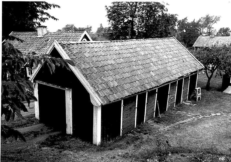
Neg. nr. V.T 04:13 Uthus mot sydost