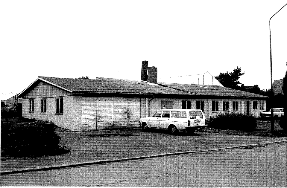
Neg. nr. V.T 04:5 Handelsträdgård mot norr