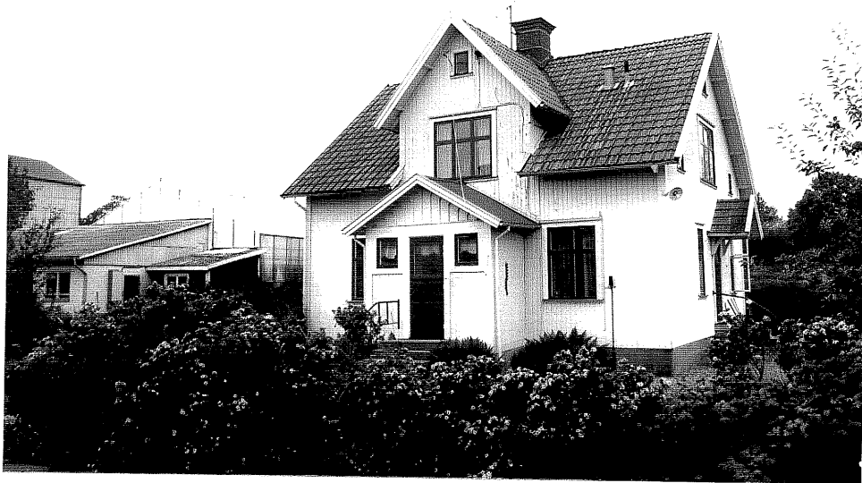
Neg. nr. V.T 04: 7 Bostadshuset mot nordväst

Ödeshögs kommun V:a Tollstad socken Hästholmens Gästgivaregård Hagaberg Hamngatan 33-35