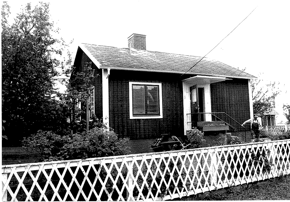
Neg. nr. V.T 04:16 Bostadshuset mot norr

Hästholmens Gästgivaregård Ängsbovägen 3