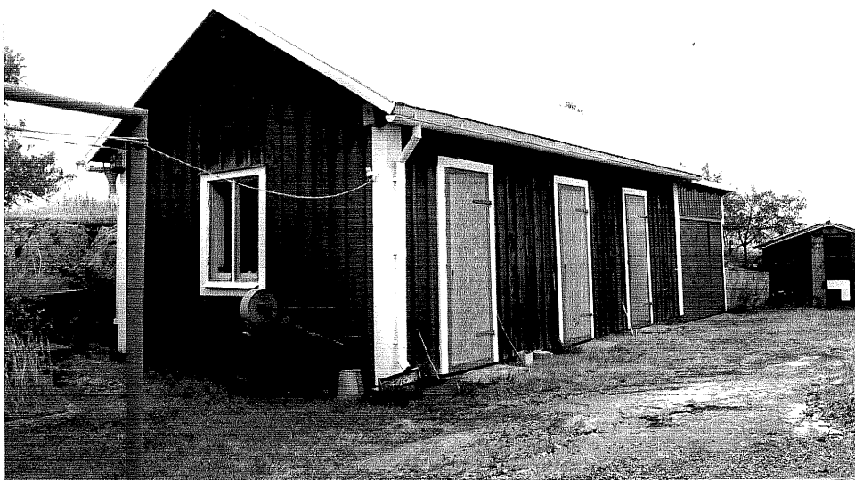
Neg. nr. V.T 04:17 Uthus mot nordväst