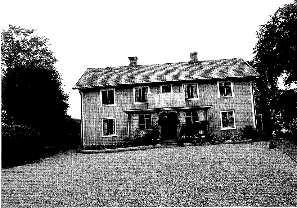
Neg. nr. V.T 04:11 Bostadshuset mot söder

Ödeshögs kommun V:a Tollstad socken Hästholmens Gästgivaregård Hamngatan 36