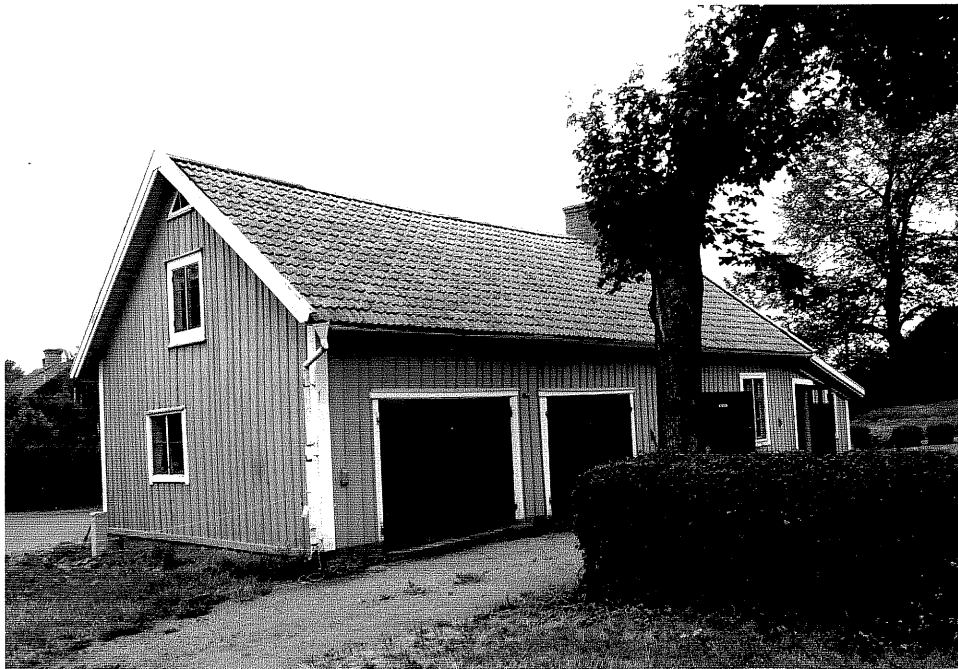
Neg. nr. V.T 04:10 Uthus mot sydost