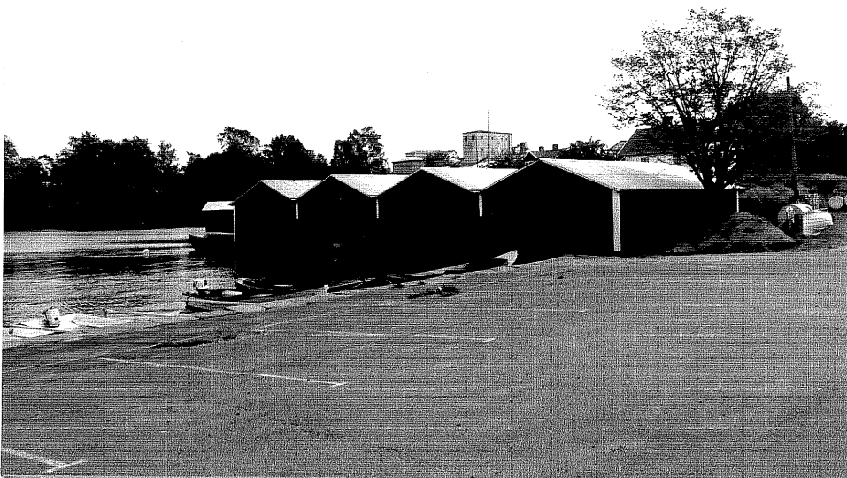
Neg. nr. V.T 05:15 Båthus mot nordväst