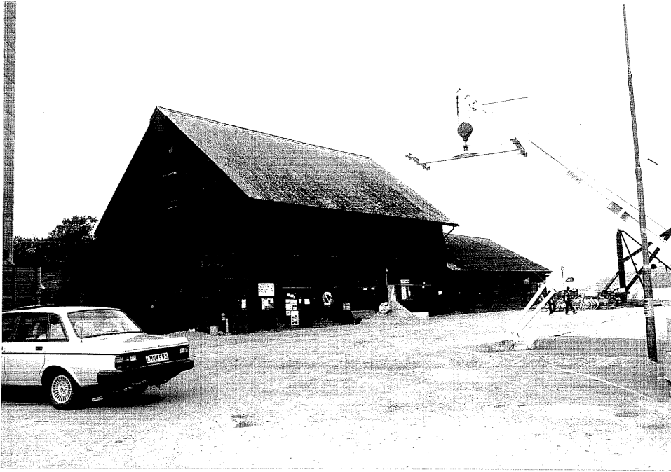
Neg. nr. V.T 05:14 Hamnmagasin och café mot sydost

Ödeshögs kommun V:a Tollstad socken Hästholmens hamn 1 1 , 1 2