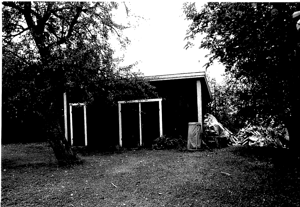
Neg. nr. V.T 01:26 Uthus mot norr