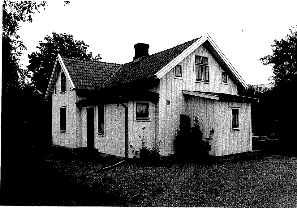
Neg. nr. V.T 01:25 Bostadshuset mot nordväst

Ödeshögs kommun V:a Tollstad socken Hästholmen 9 1 "Fredsholm" Hamngatan 17