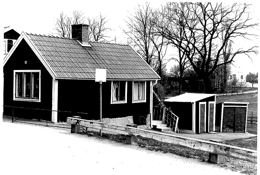
Bostadshus b fr.SV, 10:20.