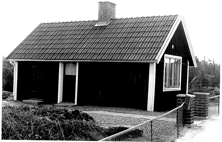
Bostadshus b fr.NV, 10:19.

Ödeshög sn Hästhoven 3 Morlidsvägen 3 foto:M.Wikdahl,1978.