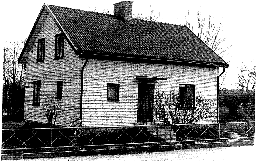
Bostadshus a fr.V, 16:17

Ödeshög sn Hästhoven 5 Morlidsvägen 1.