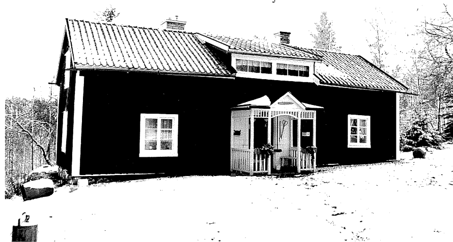
Neg. nr. T 08:07 Bostadshuset från 0