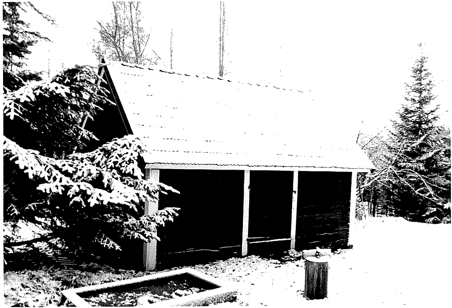
Neg. nr. T 08:09