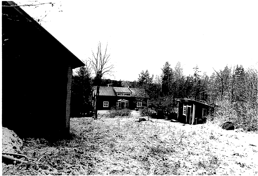
Neg. nr. T 08:15 Miljö från 0

Ödeshögs kommun Trehörna socken Höganskog 1:3 Höganskog