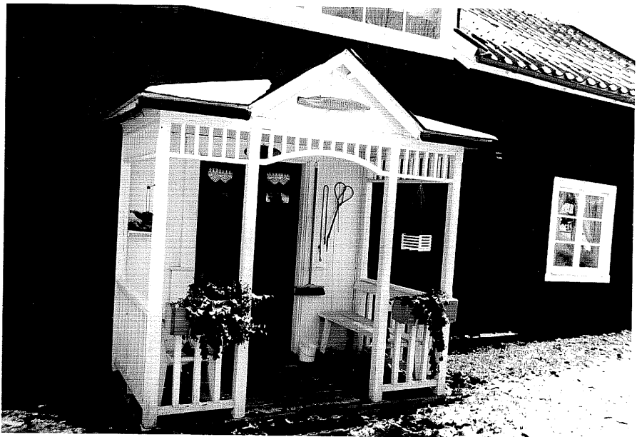
Neg. nr. T 08:08