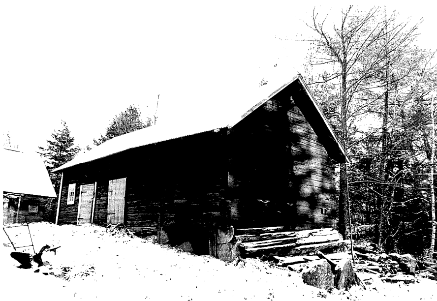
Neg. nr. T 08:11 Magasin från V