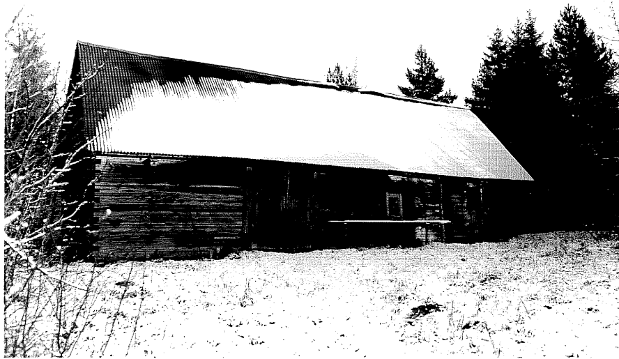
Neg. nr. T 08:12 Ladugård från SV