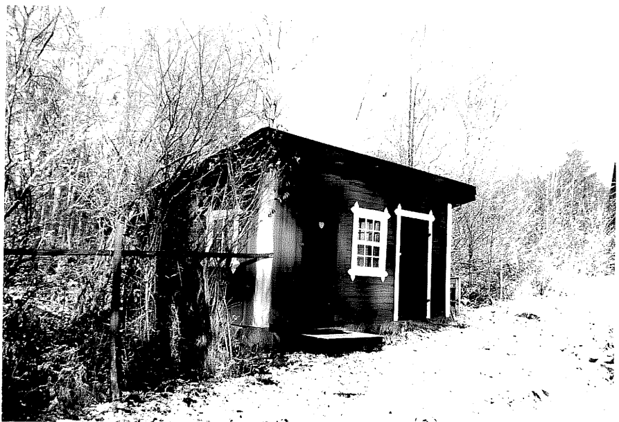
Neg. nr. T 08:10