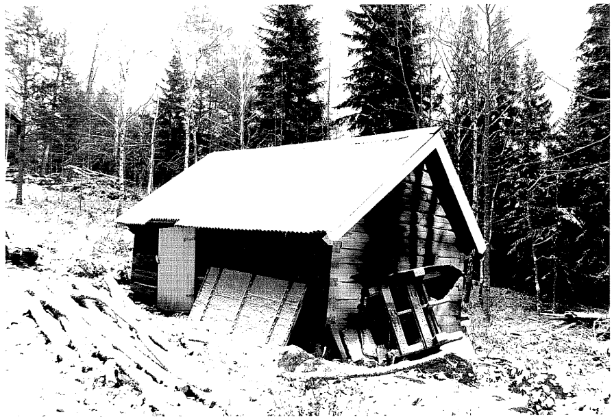
Neg. nr. T 08:16