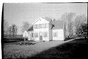
Miljösammanhang, gårdsmiljö, trädgård