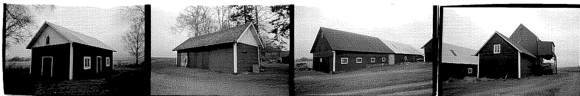
Svårhus SO 1. Garage från NV 2. Ladugård SO 3. Magasin med tosk 4. från SO