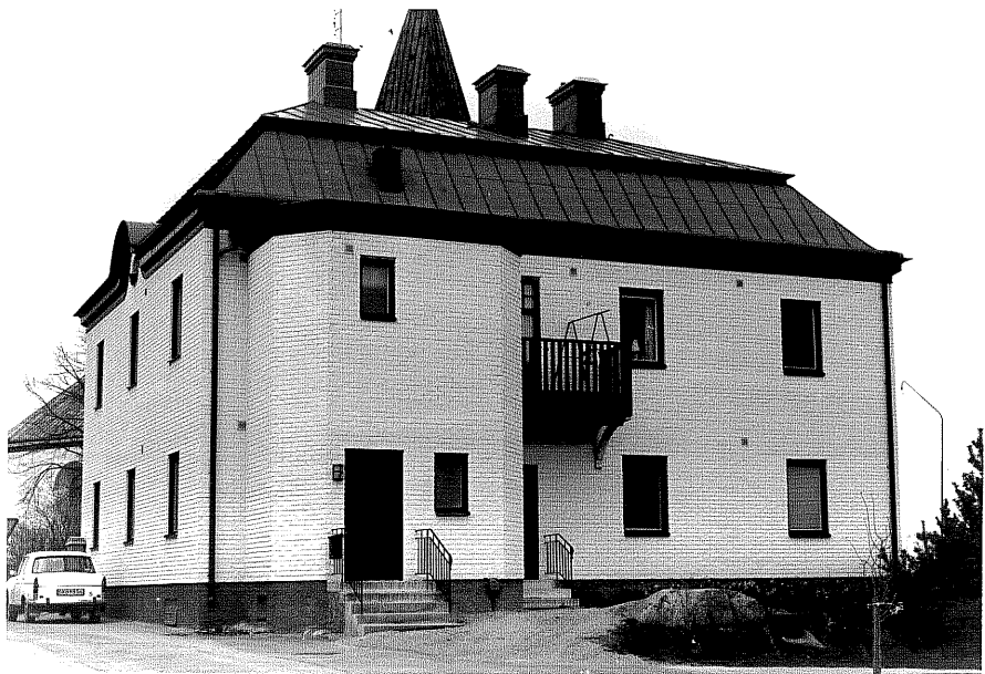
Bostadshus a fr.SO, 7:32.