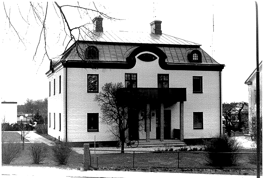
Bostadshus a fr.NV, 7:30.

Ödeshög sn Ankaret 3 Storgatan foto:M.Wikdahl, 1978.