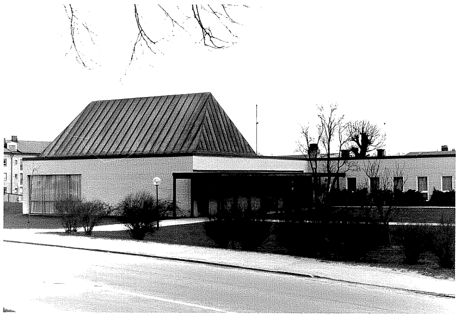
Församlingshemmet fr.V, 7:29.

Ödeshög sn Ankaret 3 Storgatan foto:M.Wikdahl,1978.