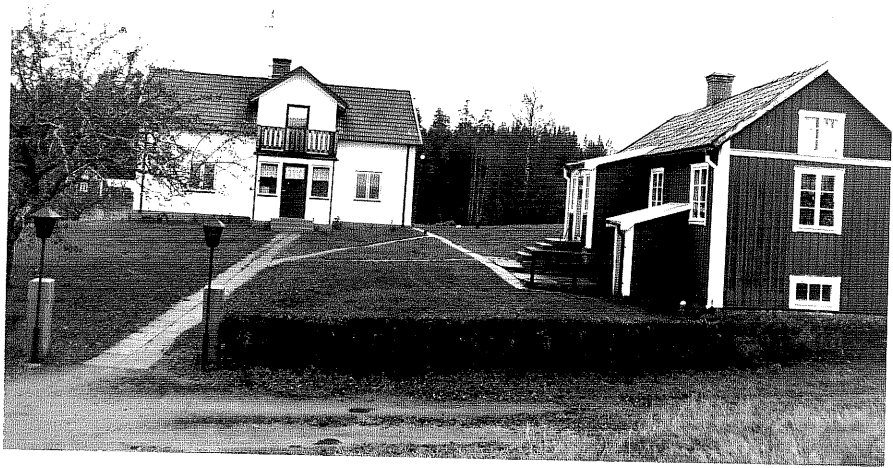
Neg. nr. T 07:01 Jägersholm från SO

Ödeshögs kommun Trehörna socken Jägersholm 1:1