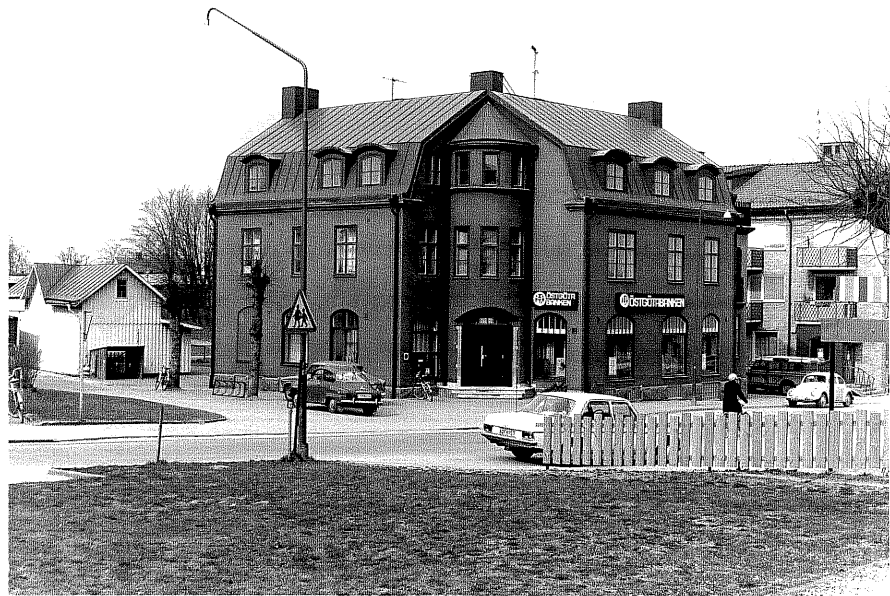
Bostadshus a fr.S0, 1:23

Ödeshög sn Apotekaren 2 Nygatan 3