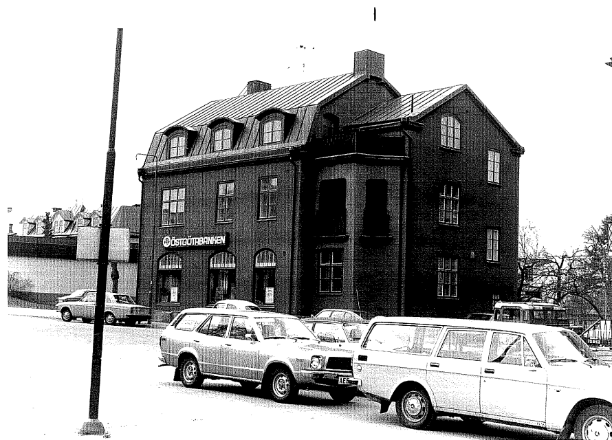
Bostadshus a fr.N, 1:22