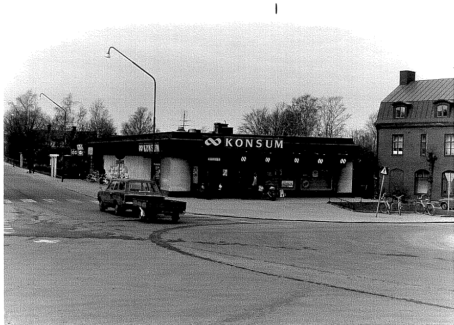
Konsumhallen fr.0, 1:25