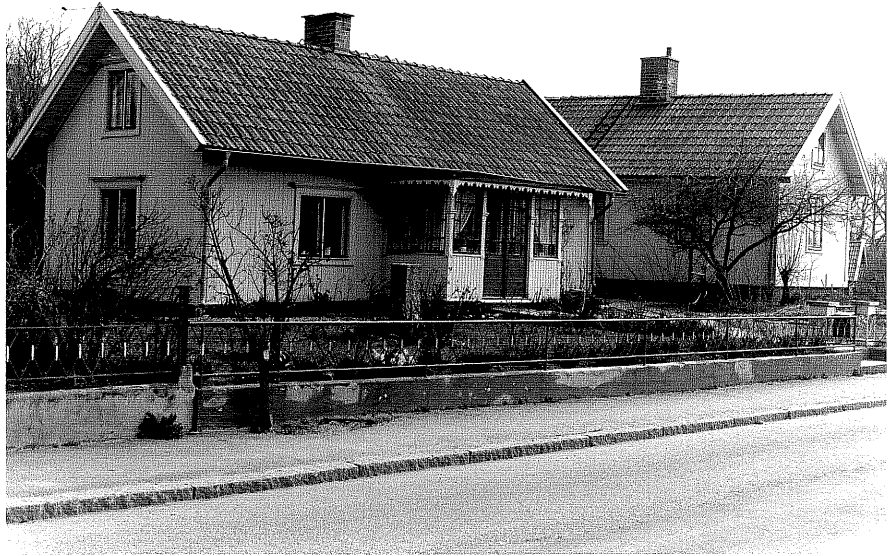
Bostadshus a och b fr.SV, 6:21.

Ödeshög sn Kanonen 10 Smedjegatan 23. foto:M.Wikdahl,1978.