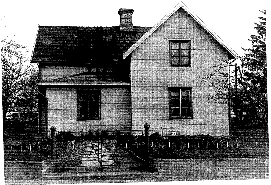
Bostadshus a fr.S, 6:23.