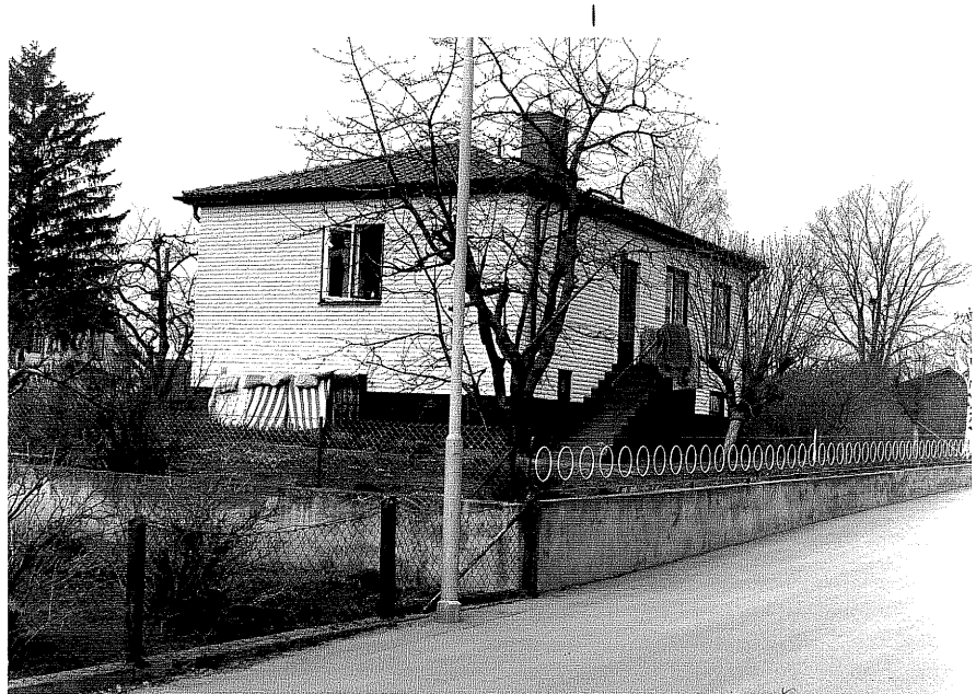
Bostadshus fr.O, 6:12.

Üdeshög sn Kanonen 2 Hemgårdsgatan 7 foto:M.Wikdahl,1978.