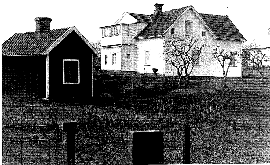
Bostadshus a och uthus b fr.NO, 6:13.

Ödeshög sn Kanonen 3 Hemgårdsgatan 5 foto:M.Wikdahl,1978.