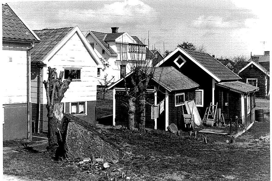
Uthus c fr.S, 6:20.