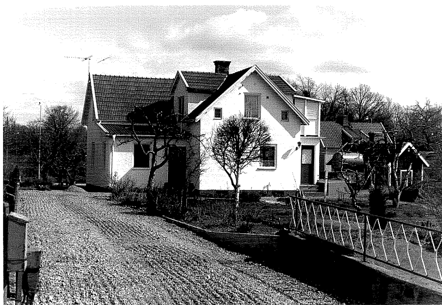
Bostadshus a fr.S, 6:18.