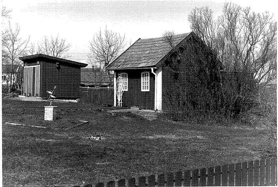
Uthus c och d fr.0, 6:16.