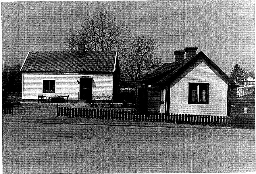
Bostadshus a och b fr.80, 6:17.

Ödeshög sn cKanonen 6 Södra vägen 72 foto:M.Wikdahl,1978.