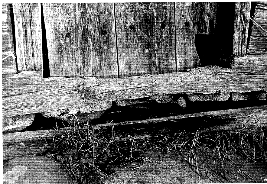
Neg. nr. T 08:27 Detalj av golv och dörr