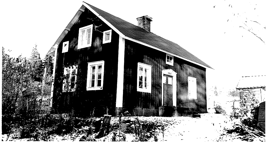
Neg. nr. T 08:24 Bostadshuset från SV

Ödeshögs kommun Trehörna socken Kerken 1:1 Kerken