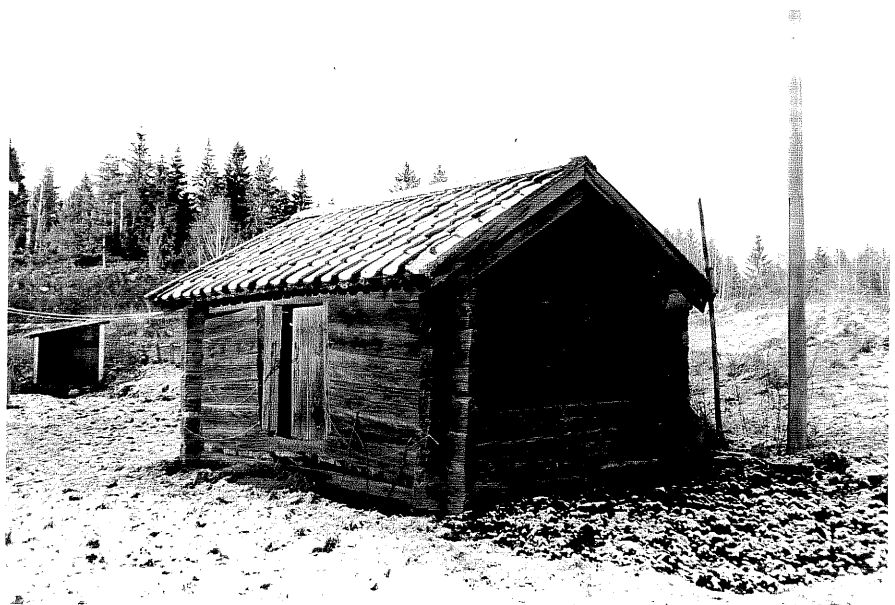
Neg. nr. T 08:25 Boden från SV