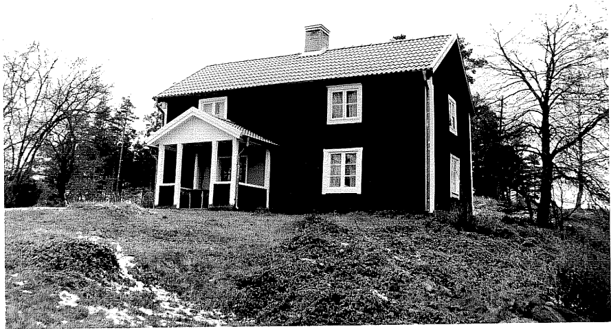
Neg. nr. T 10:33 Norra huset från S