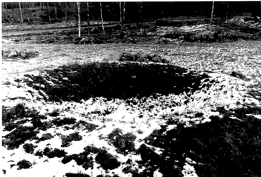
Neg. nr. 10:34 Varggrop öster om gården