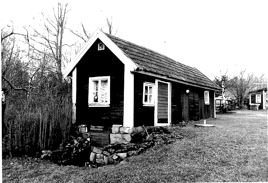
Neg. nr. T 14:38 Flygelbod från SO