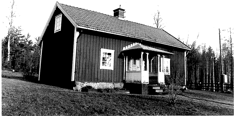
Neg. nr. T 14:37 Hagalund från SV

Ödeshögs kommun Trehörna socken Kolhult 1:3 Hagalund