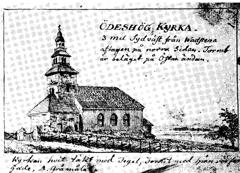
Kyrkan på komminister Eeks tid i slutet av 1700-talet, då Ödeshög var vallfartsort. Teckning av Joh. Fr. Kock.