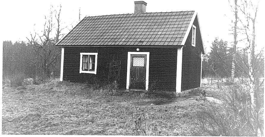
Neg. nr. T 14:26 Torpet från S0

Ödeshögs kommun Trehörna socken Kopparp 2:2 Lövhagen