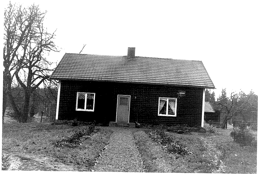
Neg. nr. T 14:28 Kopparp från S

Ödeshögs kommun Trehörna socken Kopparp 2:3 Kopparp