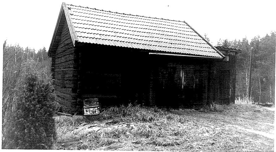
Neg. nr. T 14:29 Timrad bod från SV