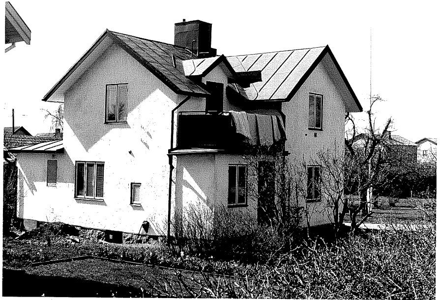
Bostadshus a fr.NO, 13:3.

Ödeshög sn Korpskylern 7 Mjälbyvägen 40.