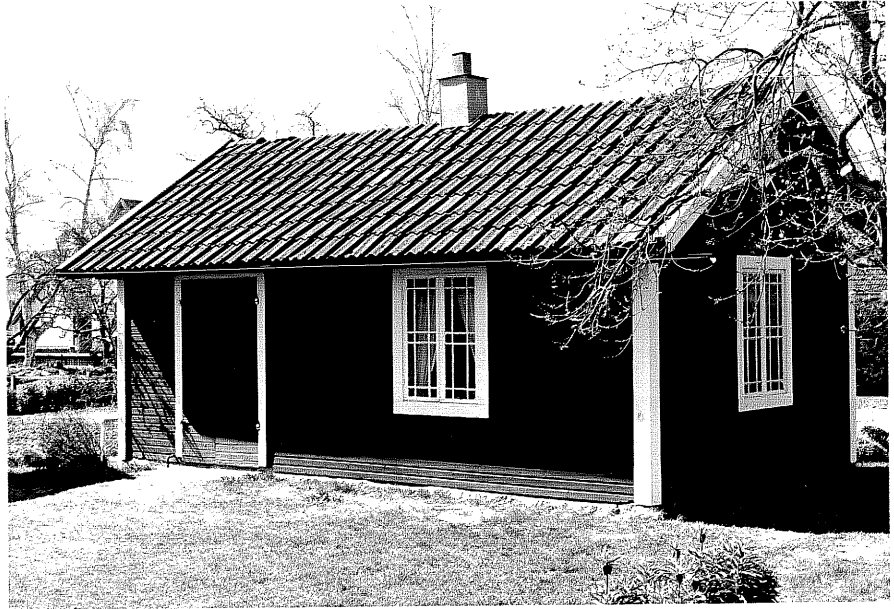
Uthus b fr.NO, 13;2 .