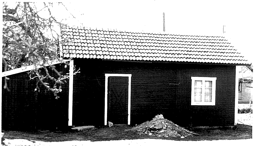
Uthus c fr.N, 13:1.