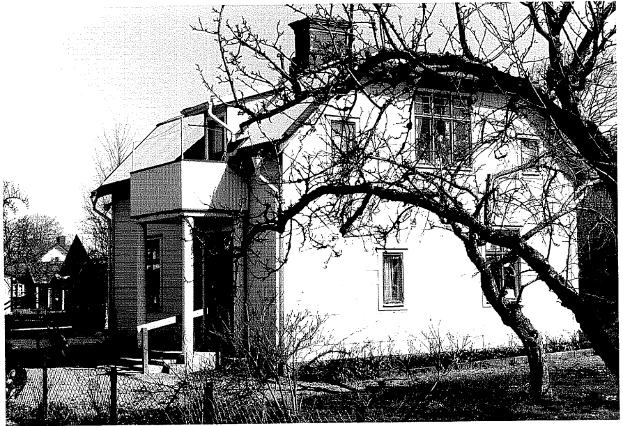
Bostadshus a fr.SV, 12:33.

Ödeshög sn Korpskylle 3 Hagagatan 5 foto:M.Wikdahl,1978.