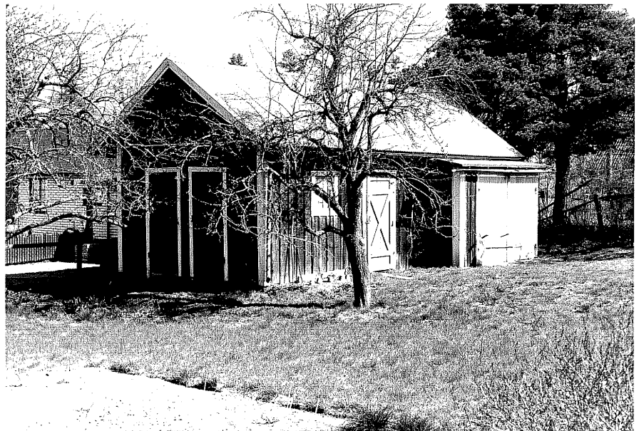
Uthus b fr.SV, 12:34.