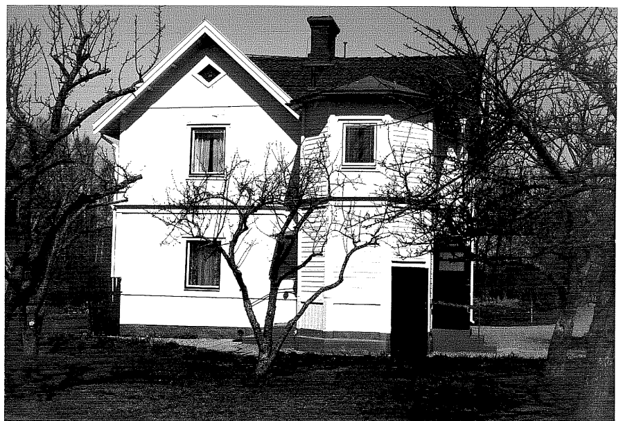
Bostadshus a fr.S, 13:4.