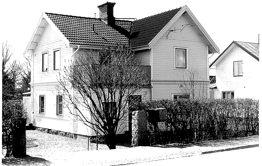
Bostadshus a fr.NO, 13:5.

Ödeshög sn Korpskyllern 8 Mjölbyvägen 42. foto:M.Wikdahl,1978.