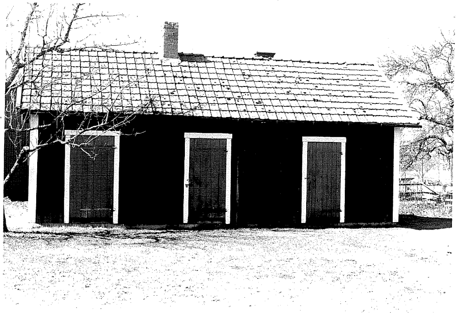
Uthus c fr,0, 13:6.

Ödeshög sn Korpskylle 9 Mjölbyvägen 46 foto:M.Wikdahl,1978.