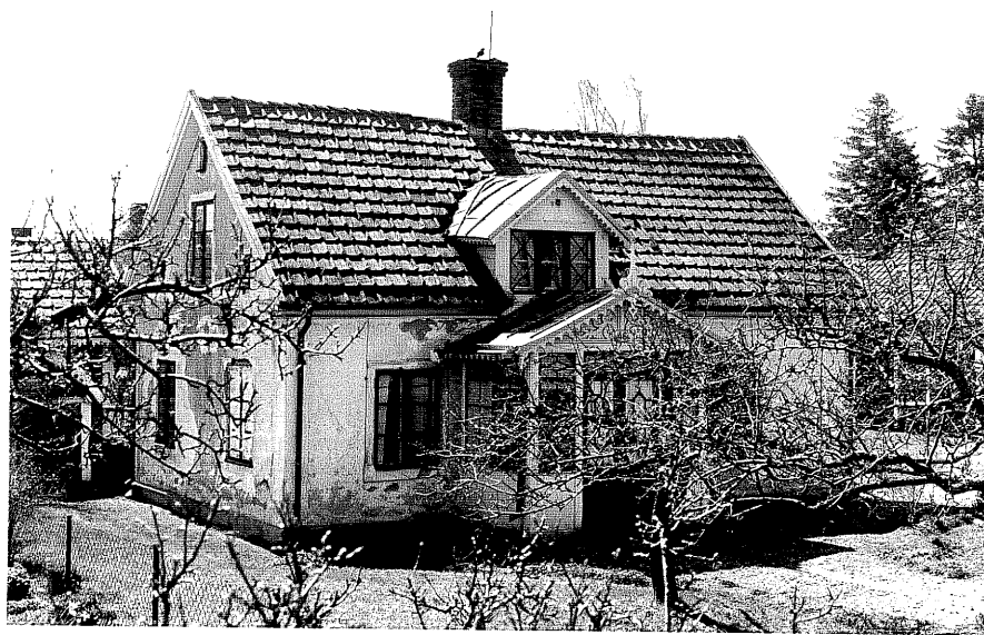
Bostadshus a fr. N, 13:10.

Ödeshög sn Korpskyllern 9 Mjölbyvägen 46 foto:M.Wikdahl,1978.