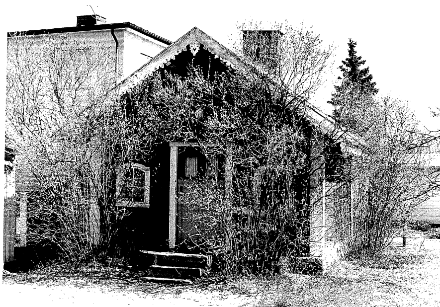
Uthus b fr.V, 13:7.