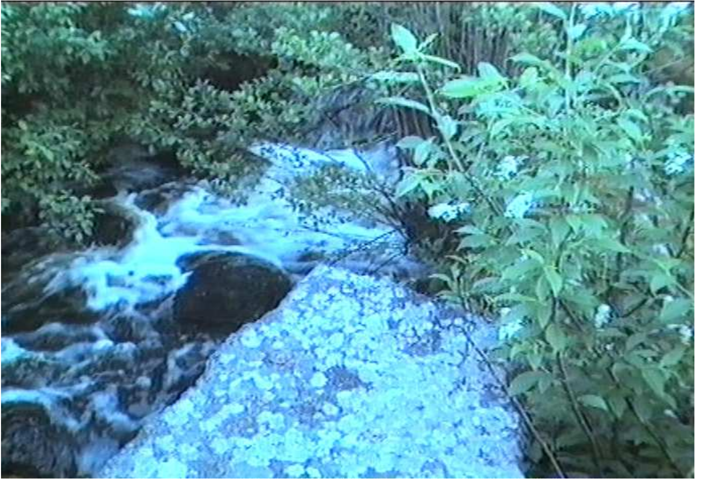
Dammfästet och grundstenarna till såghuset samt den stensatta vattenrännan finns kvar.